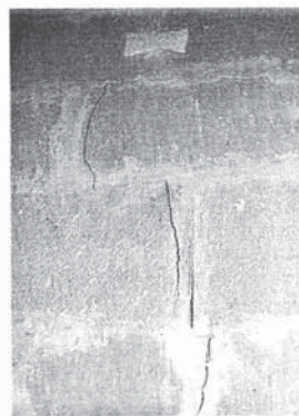
Un testigo saltado.