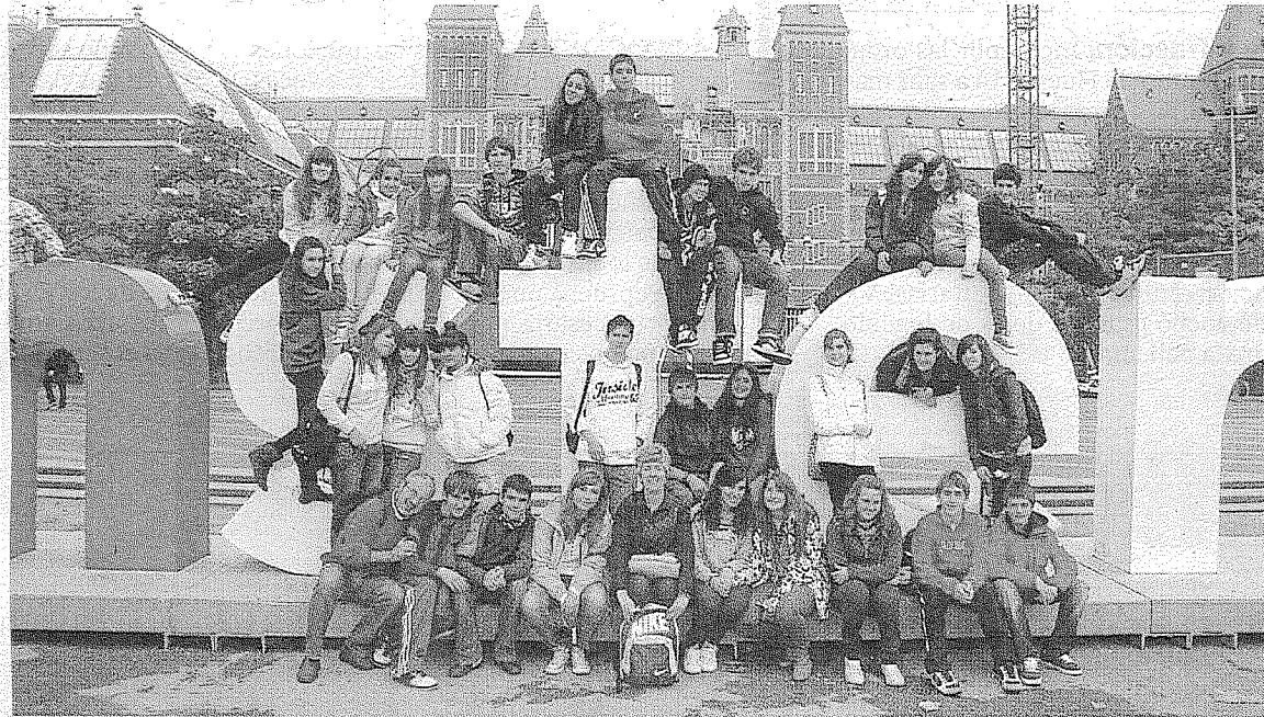
Alumnos del IES Ramón y Cajal de Huesca que participaron en el viaje a Holanda. IES RAMÓN Y CAJAL

"Creemos que la experiencia es realmente interesante tanto para alumnos como para profesores -