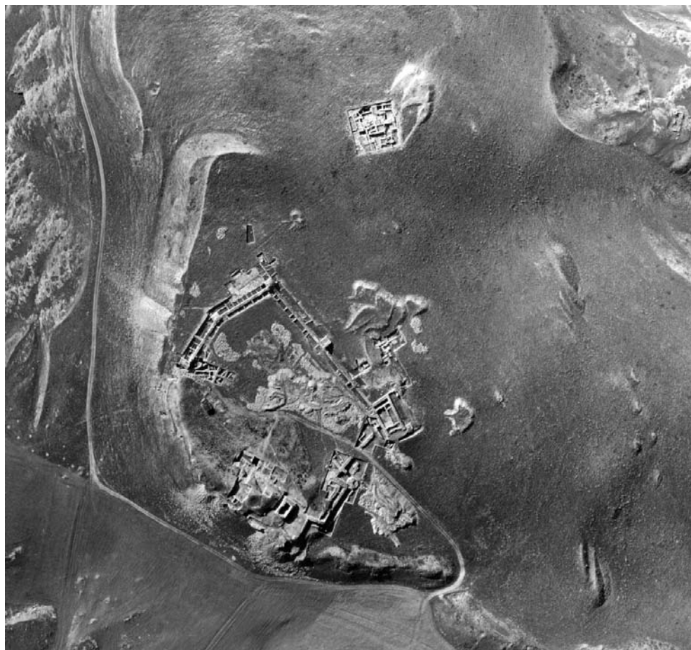
LÁM. 1. El yacimiento de Ategua (Córdoba). Fotografía aérea, 1984.

Ategua: "El día ocho fuimos a Alcalá la Real, que son cinco leguas; en el camino se pasa por un puente un riachuelo que también entra a poco trecho en el Genil. Apenas se sale de Alcalá se ven los vestigios de una ciudad antigua, la cual se cree con certeza que fue Ategua; el sitio conserva un nombre semejante, pues una fuente que hay en el se llama la Fuente de Teivela. También es buen indicio de que allí estuvo Ategua, que hay cerca un castillo que guarda su antiguo nombre de