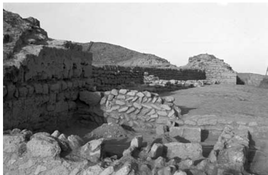
LÁM. II. Muralla medieval y estructuras adosadas. 1982.

El propósito de este artículo es dar a conocer algunos objetos metálicos de cronología andalusí que fueron hallados y documentados en el yacimiento de Ategua (Córdoba) durante las campañas de los años 1980-1982. Nos referimos a unas varillas de cabeza cónica que identificamos como husos de hilado (LÁM. III) y algunas varillas de bronce de un extremo achatado destinadas para fines cosméticos (LÁM. IV), aparte de unas pinzas cuya finalidad también podríamos clasificar como higiénico-estética. Aunque las varillas presentan un parecido morfológico considerable el uso que se les daba era completamente diferente como exponemos aquí, a partir de las fuentes escritas y los paralelos andalusíes documentados en la Península.