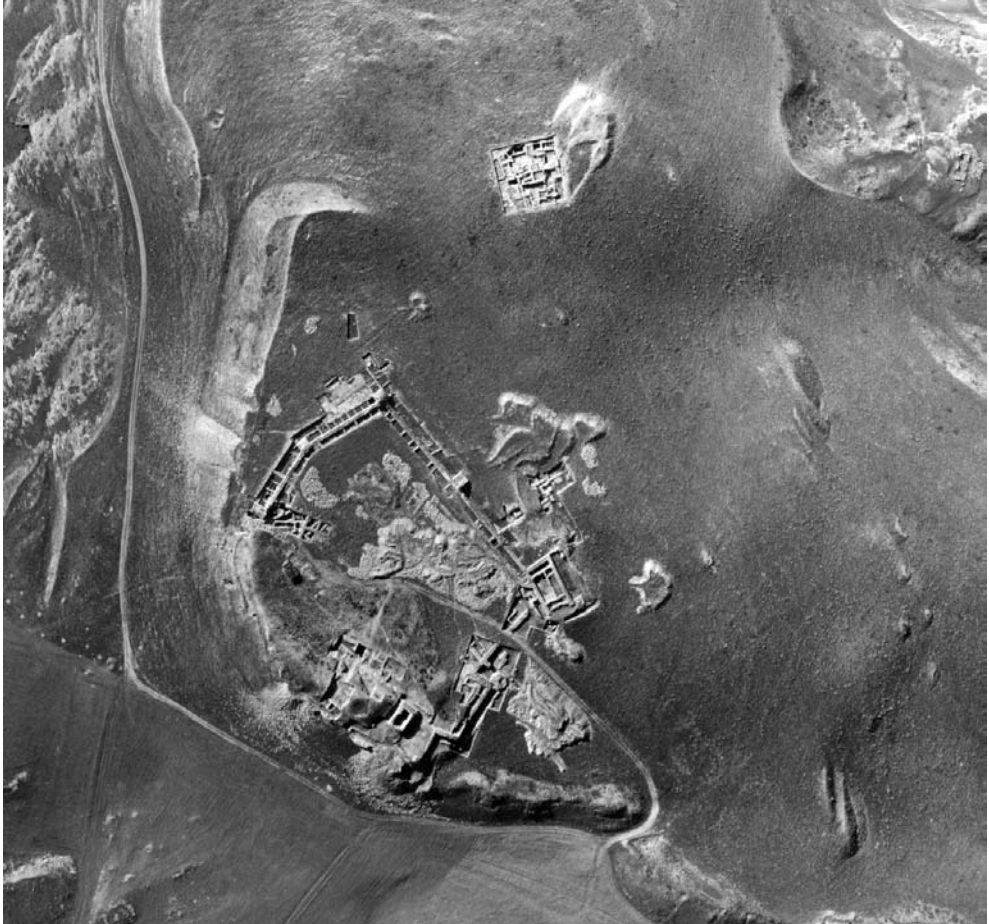
LÁM. 1. El yacimiento de Ategua (Córdoba). Fotografía aérea, 1984.

Ategua: "El día ocho fuimos a Alcalá la Real, que son cinco leguas; en el camino se pasa por un puente un riachuelo que también entra a poco trecho en el Genil. Apenas se sale de Alcalá se ven los vestigios de una ciudad antigua, la cual se cree con certeza que fue Ategua; el sitio conserva un nombre semejante, pues una fuente que hay en el se llama la Fuente de Teivela. También es buen indicio de que allí estuvo Ategua, que hay cerca un castillo que guarda su antiguo nombre de